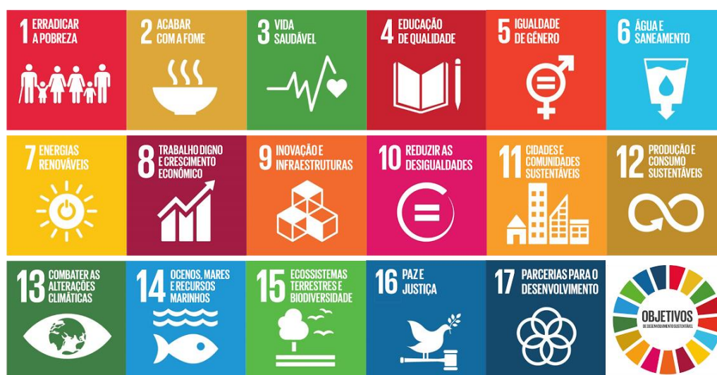
Figura 1 – Objetivos Desenvolvimento Sustentável